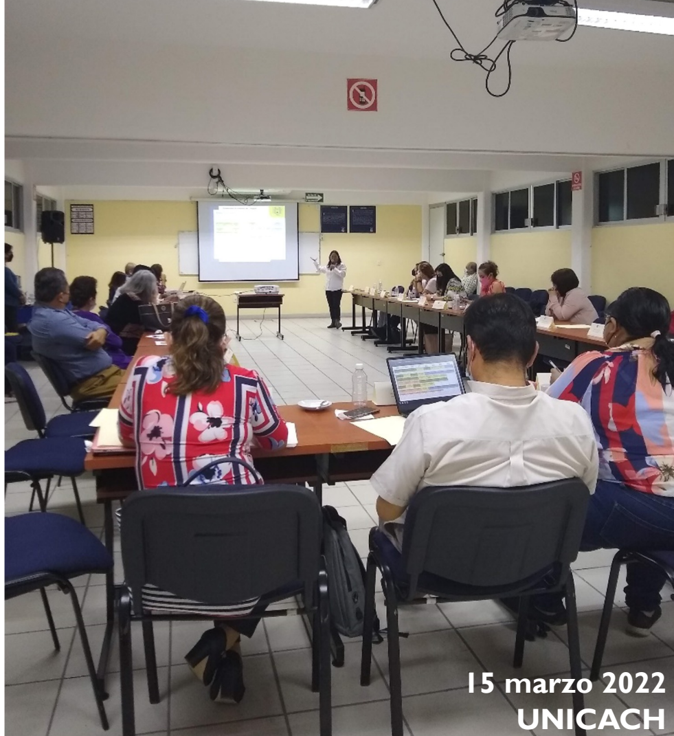
15 marzo 2022 UNICACH