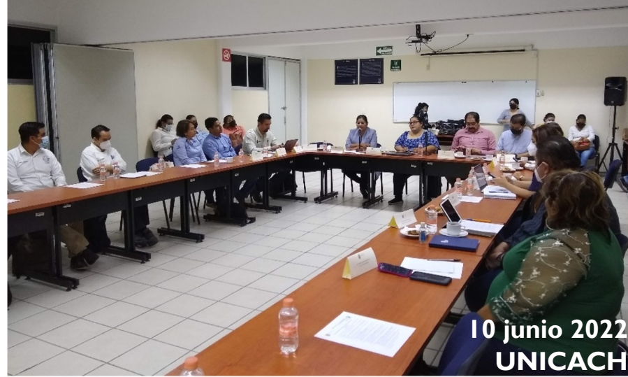
10 junio 2022 UNICACH