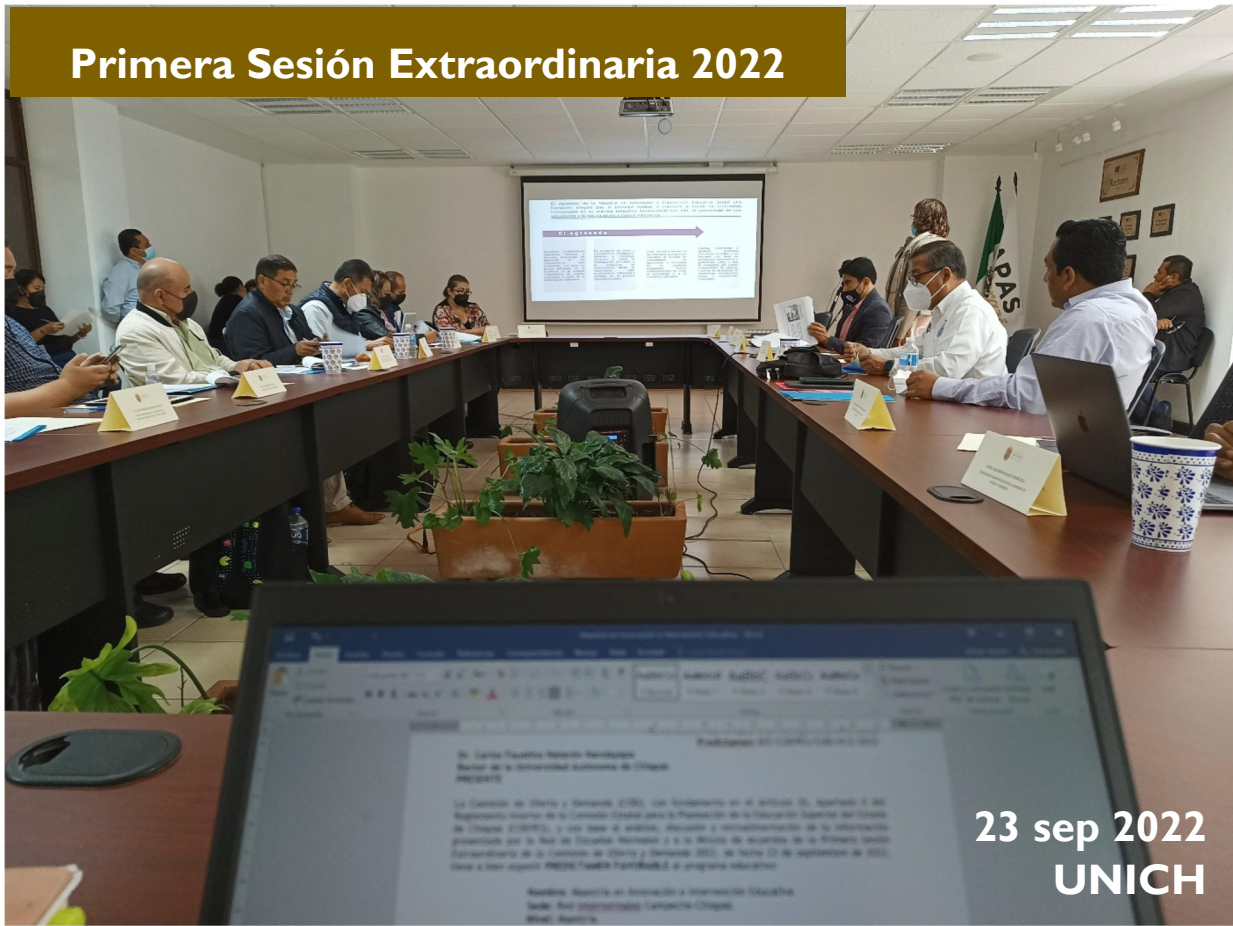
Primera Sesión Extraordinaria 2022