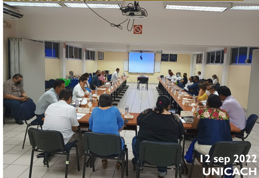
12 sep 2022 UNICACH